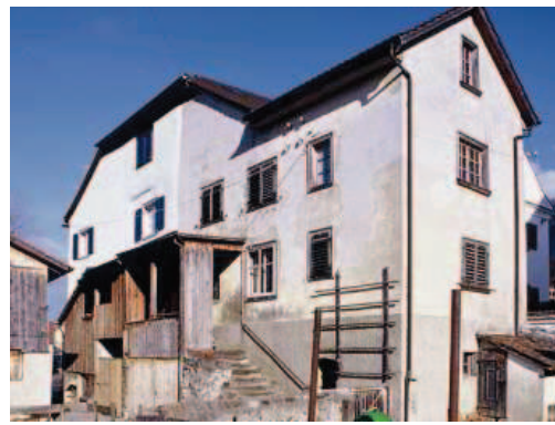
Das Ramschwaghaus in Balzers vor (links) und nach dem umfangreichen Umbau (rechts).

Das schmale Wohnhaus im Winkel gehört zum Gebäudekomplex des sogenannten «Ramschwaghauses» und erscheint architektonisch als Anbau des Hauptgebäudes, welches sich in besonders repräsentativer Gestaltung barocker Art zeigt. Die Familien von Ramschwag verwalteten von 1470 bis 1746 die Burganlage Gutenberg und besaßen das charakteristische Wohnhaus. Dieses orientiert sich zur Hauptstrasse und steht an der seit alters her die Alpen passierenden Reichsstrasse. 1795 zerstörte ein Grossbrand 72 Gebäude einschliesslich Kirche und Pfarrhof. Auch das Ramschwaghaus wurde vom Brand betroffen, wobei das genaue Schadensausmass unbe-